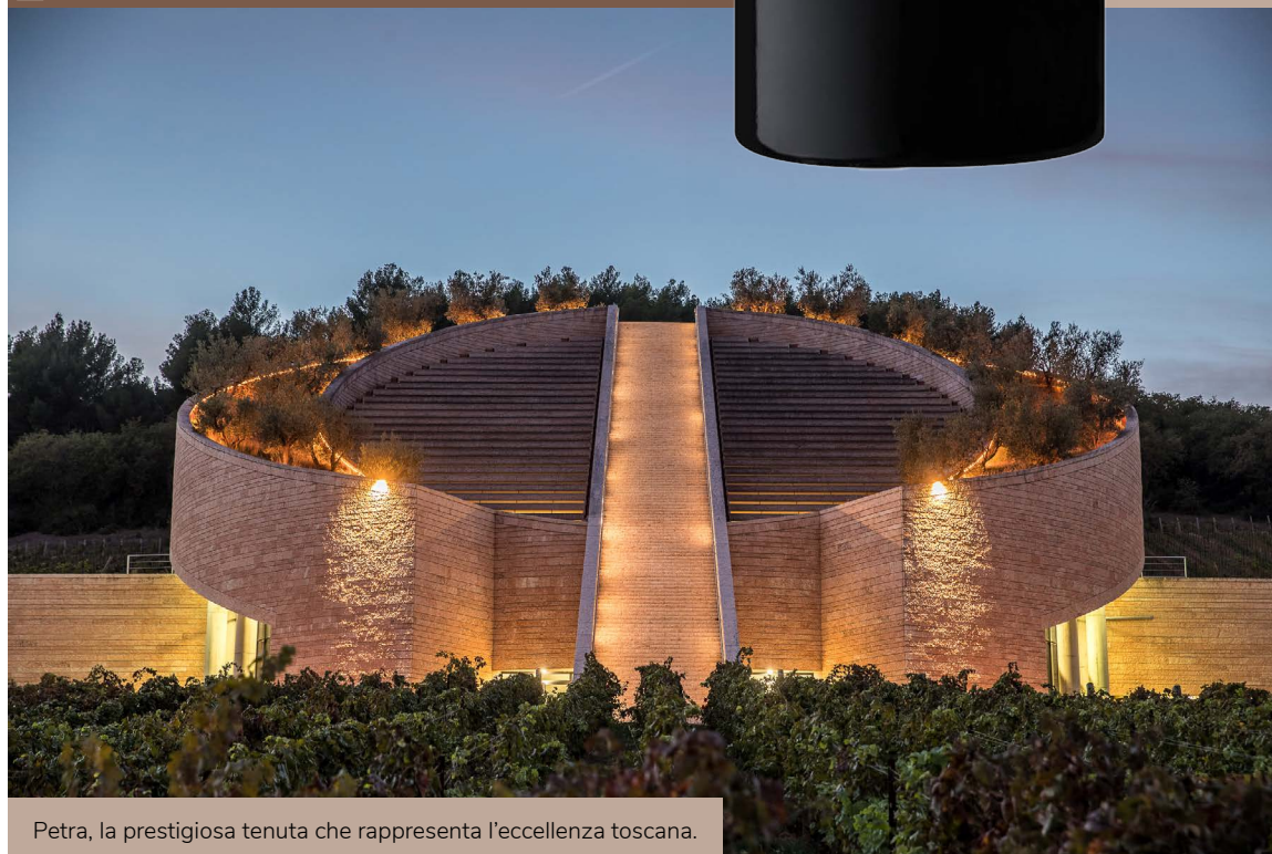
Petra, la prestigiosa tenuta che rappresenta l'eccellenza toscana.