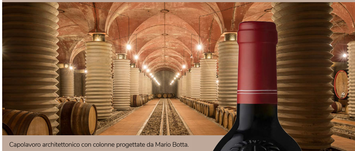
Capolavoro architettonico con colonne progettate da Mario Botta.

Petra è molto più di un'azienda vinicola: tra le colline della Maremma toscana, calcare, argilla e sabbia danno forma un terroir unico. L'edificio firmato dall'architetto Mario Botta, si integra armoniosamente nel paesaggio, divenendo parte della sua essenza. Gestione sostenibile e dialogo costante tra natura e cultura definiscono vini di eleganza, profondità e identità toscana senza tempo.